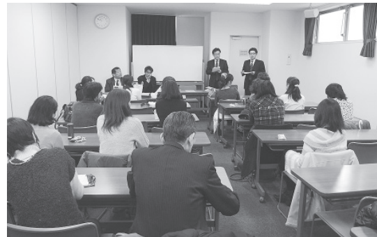
視覚障がい者との実践のようす

2014年度同研究会は、さらに実践の幅を広げていく予定です。なお、2010年度、2011年度、2012年度、2013年度の双方向コミュニケーション研究会での取組みを冊子にまとめています。