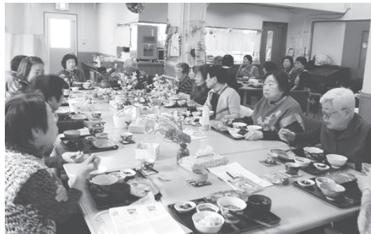
高齢者との実践のようす

ご希望の方には、2010年度版、2011年度版、2012年度版、2013年度版を各1部200円(送料別)で販売しております。KC's事務局(06-6920-2911)までお問い合わせください。