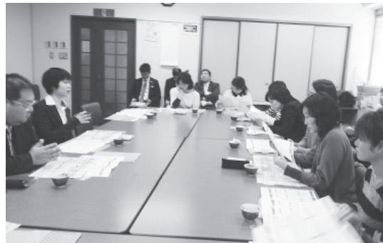
子育て層との実践のようす

シンポジウムのまとめとして、KC's 飯田副理事長は「KC'sも事業者・消費者のみならずお互いにさらにコミュニケーションが深まるよう努力し、来年また成果を持ち寄りたい」と、今年度も引き続き双方向コミュニケーション研究会を継続していく決意をのべました。