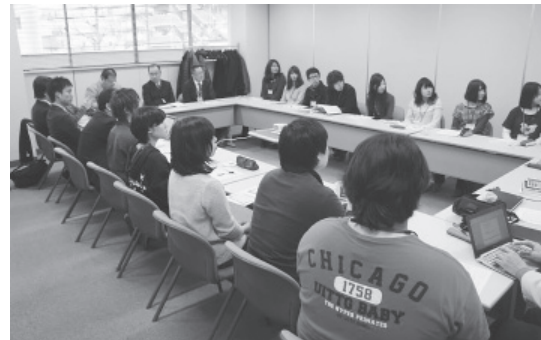
大学生との実践のようす

また、会場との意見交換の場では研究会参加者より、「消費者との場づくりがメーカー単独では出来ないで継続をしてほしい。さらに、流通の事業者の方にコミュニケーションの場を提供いただければ参加していきたい。また、視覚障がい者の方との実践後、誰でもわかるホームページづくりに取り組んでいる」「声を生かし